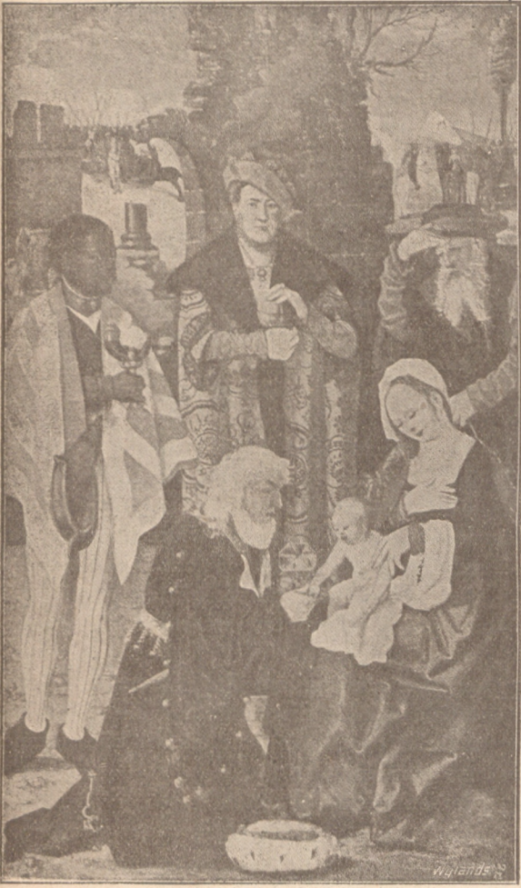
De aanbidding der Koningen naar Memling.

Blijde klinkt alom over heel de christen wereld de hemelsche kerstnachtzang der engelen: « Glorie aan God in het allerhoogste, vrede op aarde aan de menschen van goeden wil ! »