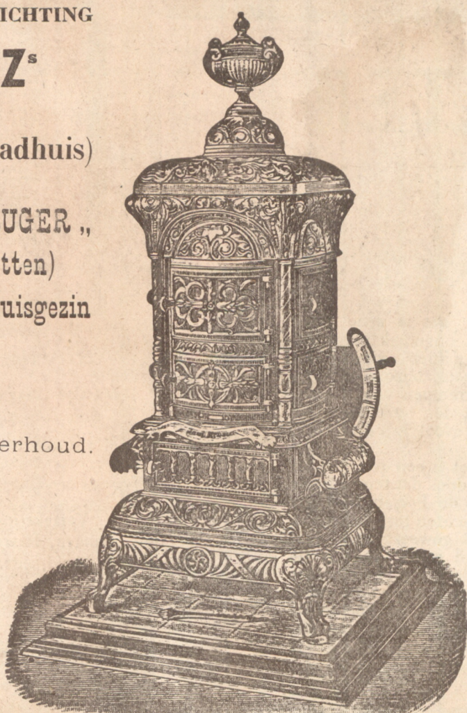
Vulkachel "PAUL KRUGER" in 3 grootten met bodemcirculatie en wijzerregeling.